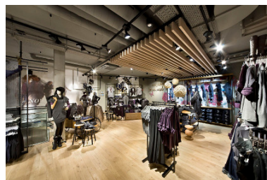
Projekt: s.Oliver, Freiburg