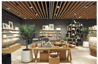
Projekt: Kastner & Öhler, Graz