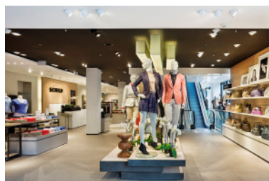
Projekt: Schild, Zürich