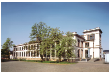
Ganter Interior, Kraftwerk, Hauptsitz Waldkirch