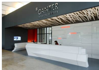
GANTER INTERIOR, Empfang in Waldkirch