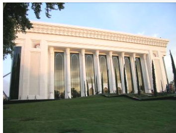
Baustelle Kongresszentrum Taschkent 16.08.2009